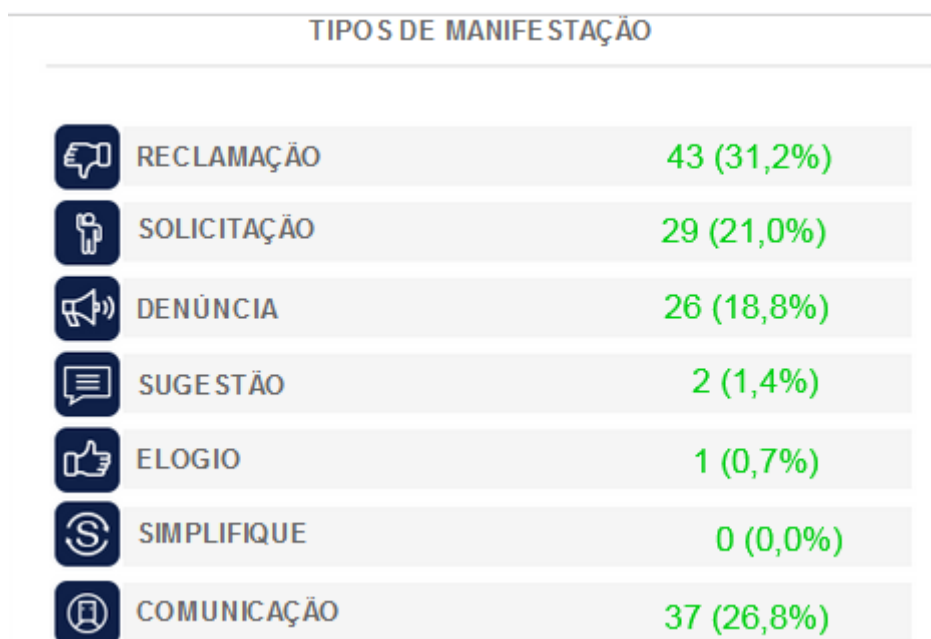
Figura 1: Tipos de Manifestações.

De forma geral as manifestações recebidas estão representadas na figura abaixo: