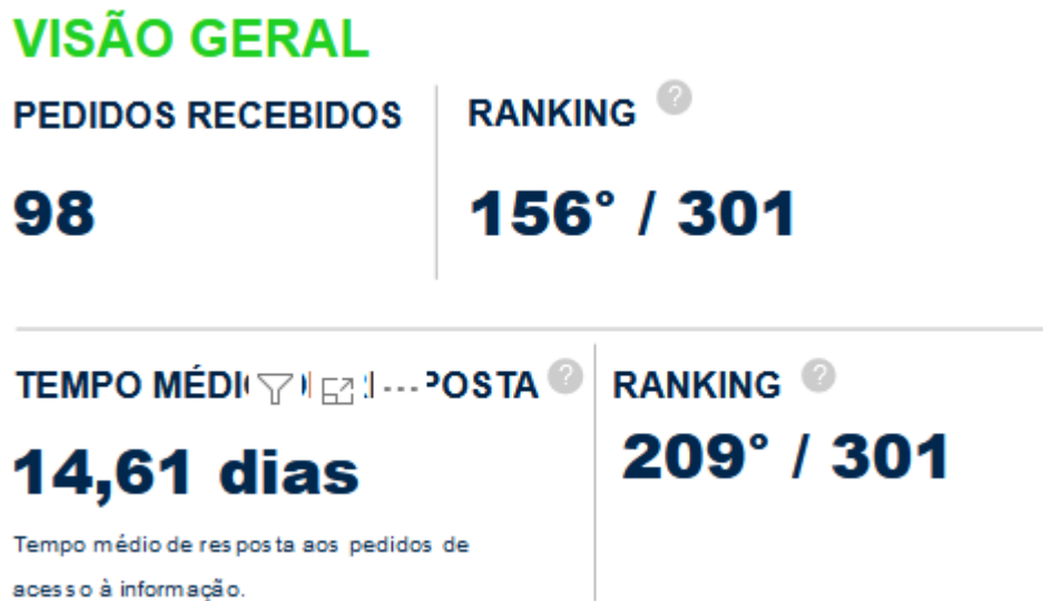
Figura 2 Pedidos de Acesso à Informação

O Serviço de Informação ao Cidadão recebeu 98 pedidos de acesso à informação com tempo médio de resposta ao cidadão de 14,61 dias. 3 Sendo uma das metas para melhora no ano vindouro.