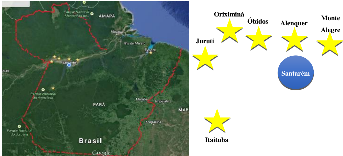
Figura 1 - Localização dos campi da UFOPA.